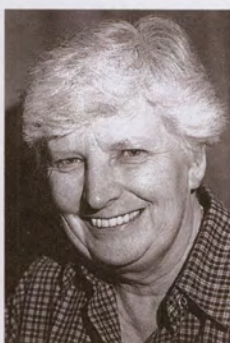
Renate Mähl (Kostüme)