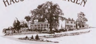
Alten- und Pflegeheim