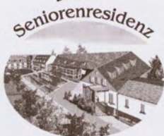
ALTEN- und PFLEGEHEIM