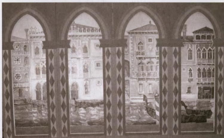
Bühnenbild von Reinhardt Lau und Helmut Schaller